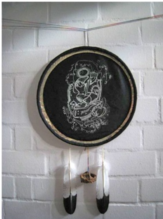
dunkelklausurschild am lebensbaum des gruppenraums